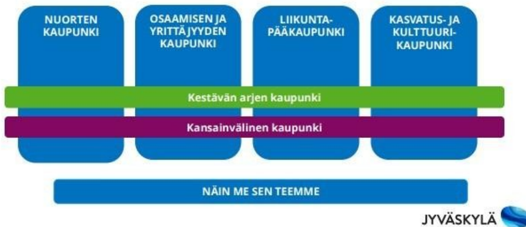
Kuvio: Jyväskylän Kaupunkistrategian arvot

Kaupunkistrategian mukaisesti toimimme esiopetuksessa ihmislähtöisesti: kuunnellen, kohdaten ja kunnioittaen. Katsomme rohkeasti tulevaisuuteen ja kokeilemme uusia tekemisen tapoja. Kestävä toiminta, jossa otamme huomioon ihmiset, ympäristön ja talouden vastuullisuutta. Rakennamme luottamusta ja turvaa tuleville sukupolville. Lapsen oikeuksien edistäminen on olennainen osa tätä työtä. Avoimuus on myös esiopetuksessa vuoropuhelua, tiedon jakamista ja osallistumisen mahdollistamista. Turvallisuus on perusta hyvinvoinnille ja luottamukselle.